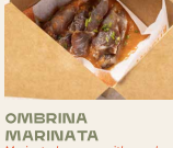
OMBRINA MARINATA Marinated meagre with purple cabbage on gazpacho