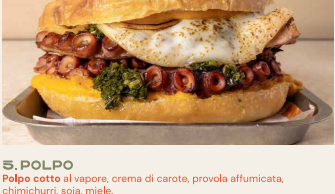
5. POLPO Polpo cotto al vapore, crema di carote, provola affumicata, fusa, basilico. Steamed octopus, carrot cream, smoked provola, chimichurri, soy sauce, honey.