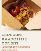
PEPERONI ARROSTITI E CONDITI Roasted and seasoned bell peppers