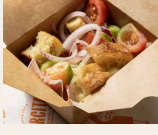
CIALLEDDA (Salad with stale bread, tomatoes, onions)