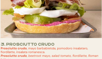
3. PROSCIUTTO CRUDO Prosciutto crudo, mayo barbabietola, pomodoro insalatato, fiordilatte, insalata romanesca. Prosciutto crudo, beetroot mayo, salad tomato, fiordilatte, Roman lettuce.