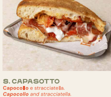
S.2. CAPASOTTO Capocollo e stracciatella. Capocollo and stracciatella.