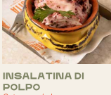
INSALATINA DI POLPO Octopus salad