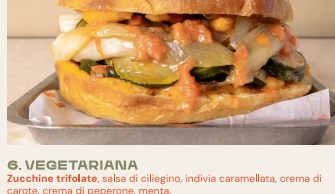
6. VEGETARIANA Zucchine trifolate, salsa di ciliegino, indivia caramellata, crema di cicorie, crema di peperone, menta. Sautéed zucchini, cherry tomato sauce, caramelized endive, carrot cream, pepper cream, mint.