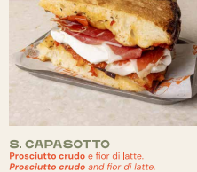
S.3. CAPASOTTO Prosciutto crudo e fior di latte. Prosciutto crudo and fior di latte.