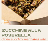
ZUCCHINE ALLA POVERELLA Fried zucchini marinated with vinegar, garlic and mint