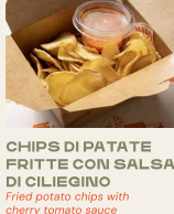
CHIPS DI PATATE FRITTE CON SALSA DI CILIEGINO Fried potato chips with cherry tomato sauce