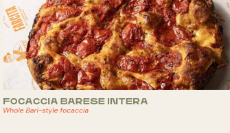
FOCACCIA BARESE INTERA Whole Bari-style focaccia