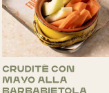
CRUDITE CON MAYO ALLA BARBABIETOLA Crudites with beetroot mayo