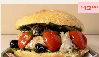
7. BACCALA Baccalà in umido, pomodoro ciliegino, cipolla, olive, capperi, crema di cicoria, crema di peperone, menta. Stewed salt cod, cherry tomatoes, onion, olives, capers, chicory cream, white wine, extra virgin olive oil, breadcrumbs.