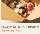
BACCALA IN UMIDO Stewed salt cod