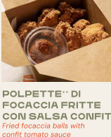
POLPETTE DI FOCACCIA FRITTE CON SALSA CONFIT Fried focaccia balls with confit tomato sauce