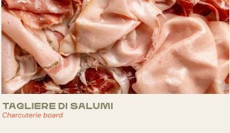
TAGLIERE DI SALUMI Charcuterie board

Dell'Azienda Agricola Querceta, serviti con focaccia calda. From the Querceta farm, served with warm focaccia.