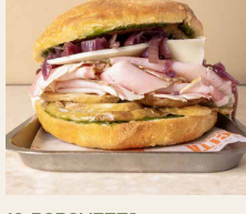
10. PORCHETTA Porchetta prosciuttata, patate, crema di cicoria, provola, cipolla alla sola, rosmarino, olio. Porchetta prosciuttata, potatoes, chicory cream, provola, soy onion, rosemary, oil.