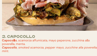
2. CAPOCOLLO Capocollo, scamorza affumicata, mayo peperone, zuccina alla poverella, menta. Capocollo, smoked scamorza, pepper mayo, zucchini alla poverella, mint.