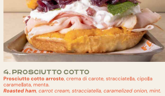
4. PROSCIUTTO COTTO Prosciutto cotto arrosto, crema di carote, stracciatella, cipolla caramellata, menta. Roasted ham, carrot cream, stracciatella, caramelized onion, mint.