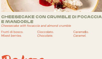
CHEESECAKE CON CRUMBLE DI FOCACCIA E MANDORLE Cheesecake with focaccia and almond crumble

Frutti di bosco. Cioccolato. Caramello. Mixed berries. Chocolate. Caramel.