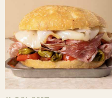
11. SALAME Salame, scamorza affumicata, acciughe, friggelli, ciliegino arrosto con timo. Salami, smoked scamorza cheese, anchovies, friggelli peppers, roasted cherry tomatoes with thyme.