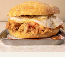
9. PARMIGIANA Parmigiana di melanzane, provola affumicata fusa, basilico. Eggplant Parmigiana, melted smoked provola, fresh basil.