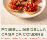
FRISELLINE DELLA CASA DA CONDIRE Homemade Apulian bread bites to be seasoned