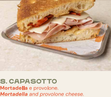
S.1. CAPASOTTO Mortadella e provolone. Mortadella and provolone cheese.