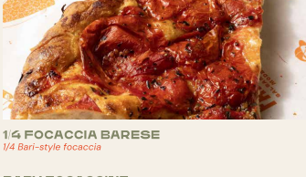
1/4 FOCACCIA BARESE 1/4 Bari-style focaccia