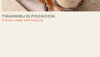
TIRAMISU DI FOCACCIA Tiramisu made with focaccia