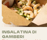
INSALATINA DI GAMBERI Shrimp salad with zucchini, green apple, and chimichurri