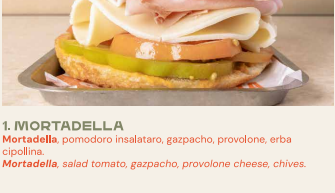
1. MORTADELLA Mortadella, pomodoro insalatato, gazpacho, provolone, erba cipollina. Mortadella, salad tomato, gazpacho, provolone cheese, chives.

Mozzarella senza lattosio (+€1,00) Lactose-free mozzarella