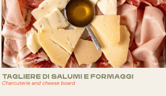
TAGLIERE DI SALUMI E FORMAGGI Charcuterie and cheese board